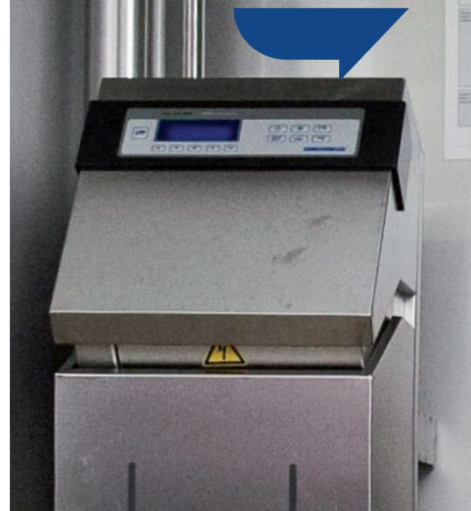
↑ MIII kontrol ünitesi Süt sıcaklığı, tarih ve saat, tüm sistem durum bilgisini gösteren geniş gösterge.