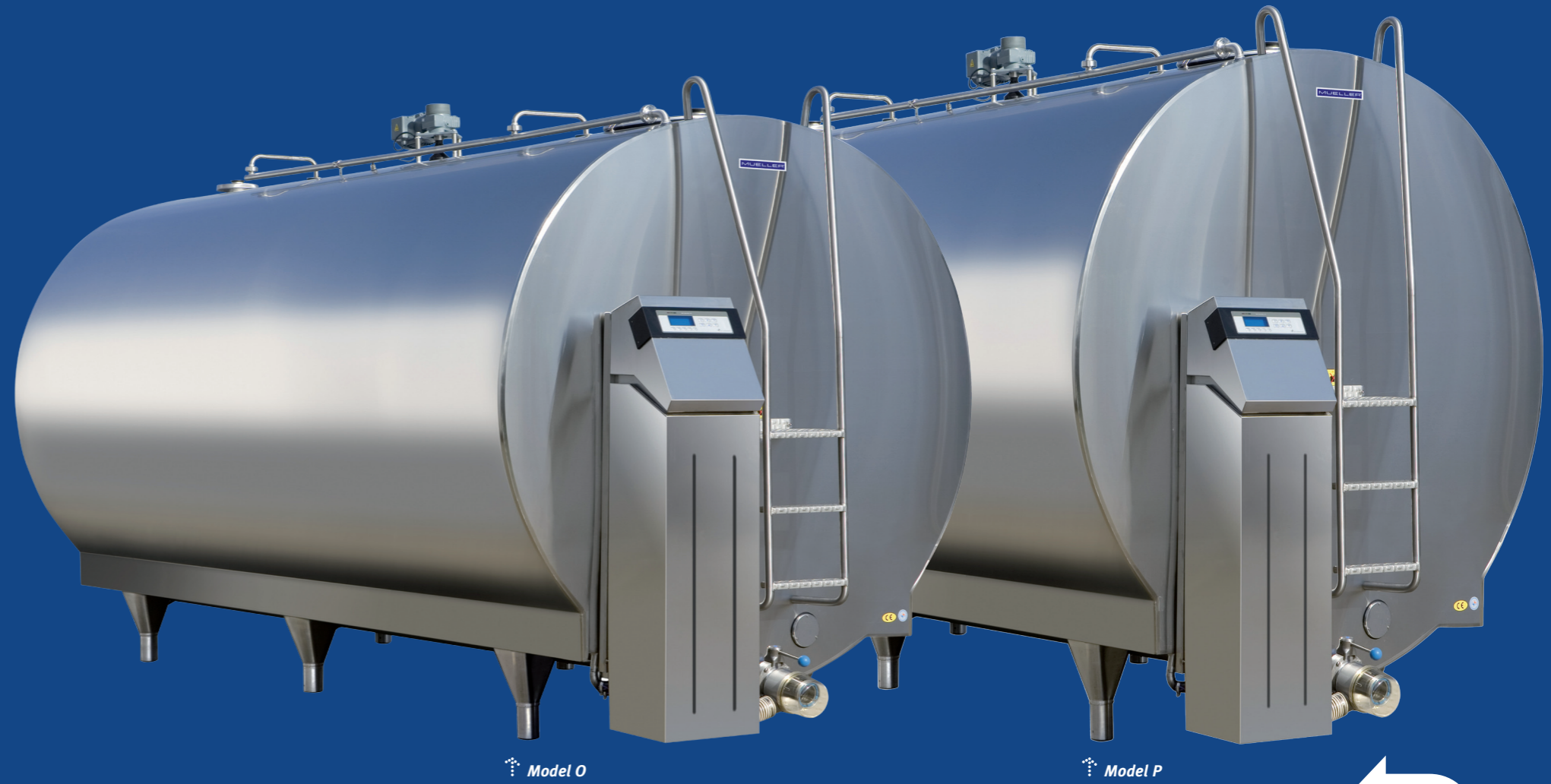
↑ Model O

Mueller O ve P model süt soğutma tankları yüksek kalite, mükemmel işçilik, kusursuz soğutma kalitesi ve uygun fiyat özelliğine sahip tanklardır. Mueller Süt Soğutma tankları düşük enerji tüketimiyle hızlı soğutma sağlar. Tankların şekli temp-plate® soğutma plakalarına olanak sağlar, tankın iç kısmının altında bulunan bu plakalar, mümkün olduğu kadar geniş yüzey alanına yayılmıştır.